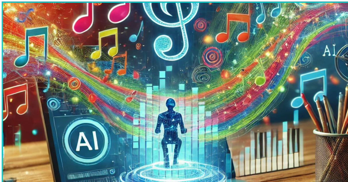
JAK SI CHATGPT PŘEDSTAVUJE SUNO

Suno je jedinečný nástroj, který využívá umělou inteligenci k tvorbě hudby. Ať už hledáte zábavný způsob, jak si vyzkoušet roli hudebního skladatele, nebo chcete přinést do výuky něco nového, Suno vás překvapí svou jednoduchostí a kreativním potenciálem.